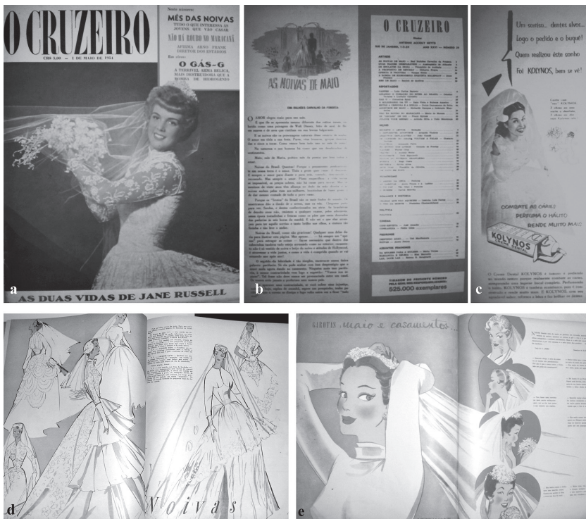
Figuras 4a-b-c-d-e: 4a) Ano de 1954; 4b) Ano de 1954; 4c) Ano de 1954; 4d) Ano de 1954 e 4e) Ano de 1954. Revista O Cruzeiro .

As articulações construídas, por meio do tema do casamento, manifestam diferentes discursos, como a publicidade e a moda. Ambos articulam-se com a ideia de explorar cenas do cotidiano. De acordo com Sant'Anna (2008, p. 61), a publicidade procurava acompanhar o espírito do momento político, pelo qual o nosso país passava, relacionado com um processo de "aceleração da corrida rumo ao desenvolvimento