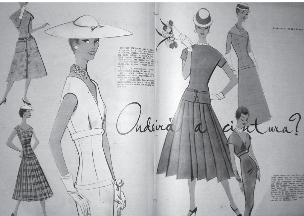
Figura 2: "Onde irá a cintura?", da coluna Figurinos na revista O Cruzeiro , 1955, v. 51, p. 110-111.