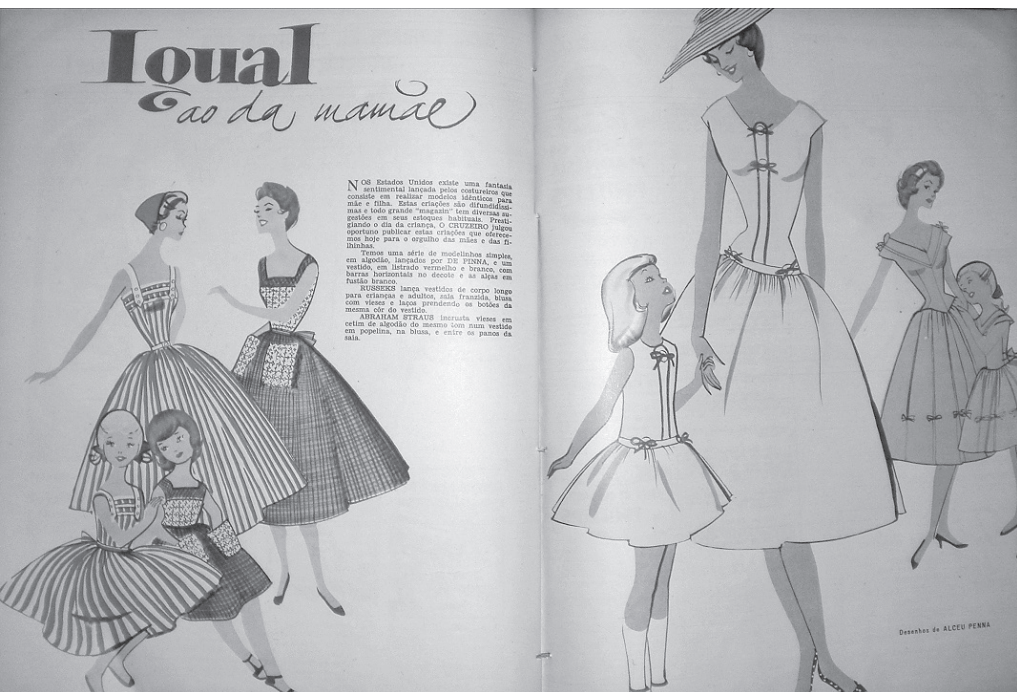
Figura 1: "Igual ao da mamãe", da coluna Figurinos na revista O Cruzeiro , 1955, v. 53, p. 110-111.