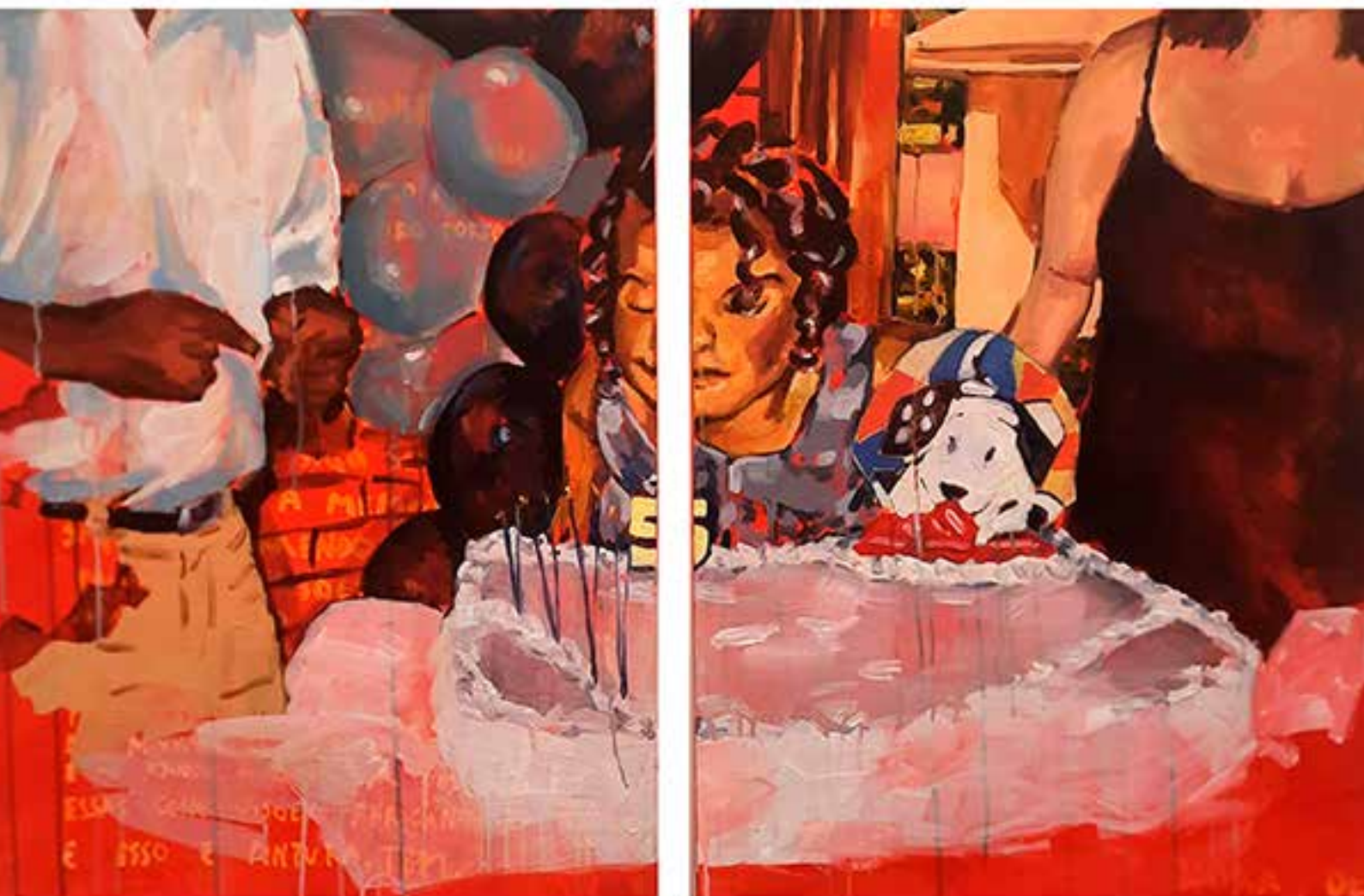
Fragmento (díptico), 2022. Acrílica sobre tela 80 x 125 cm.