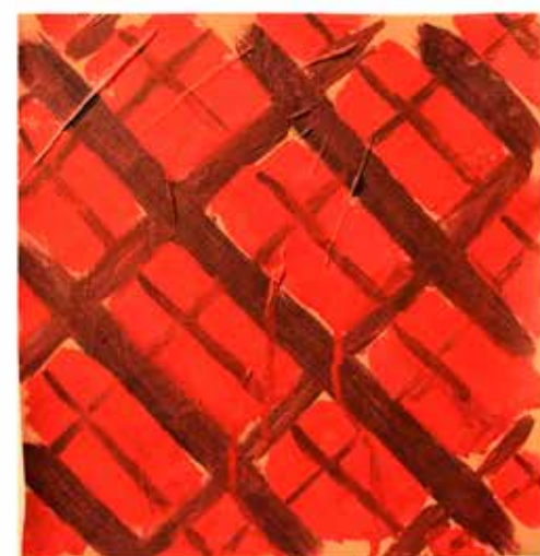
Este solo é ruim para certos tipos de flores (detalhe), 2020-2021. Acrílica sobre tela 240 x 600 cm (aprox).