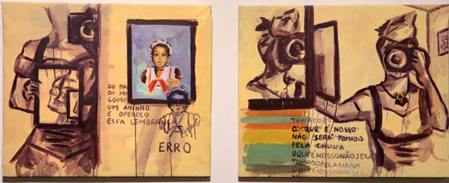
Lembrança e Futuro (díptico), 2021. Acrílica sobre tela 63 x 75 cm (cada).