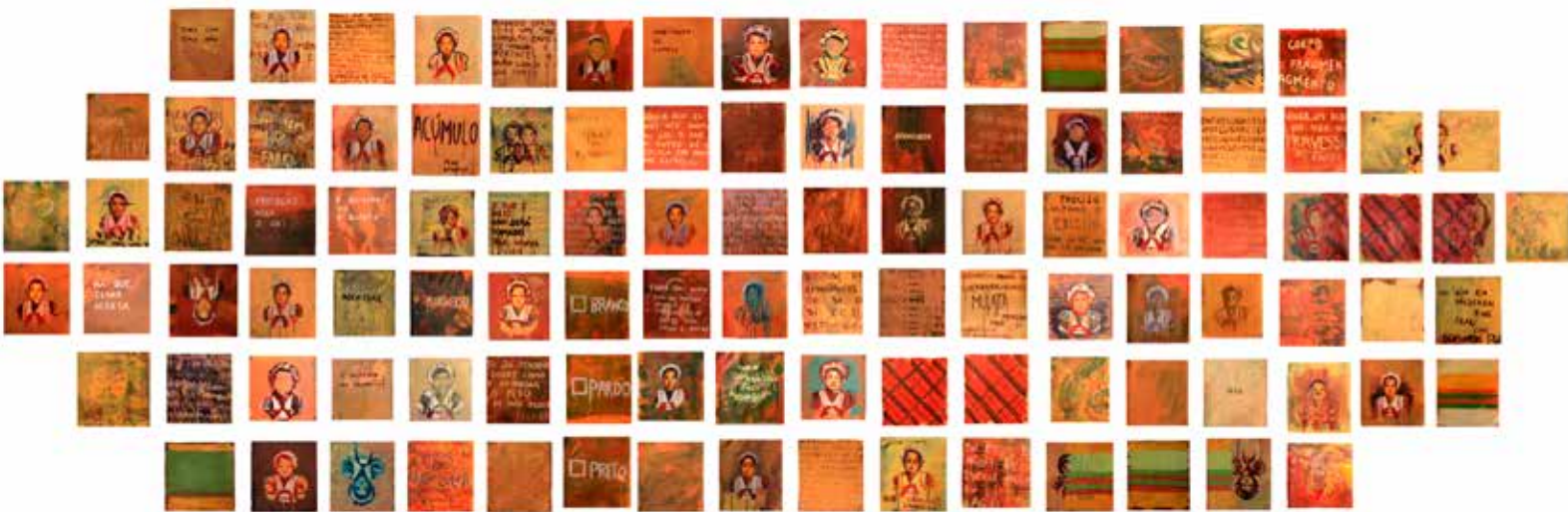
Este solo é ruim para certos tipos de flores, 2020-2021. Acrílica sobre tela 240 x 600 cm (aprox).