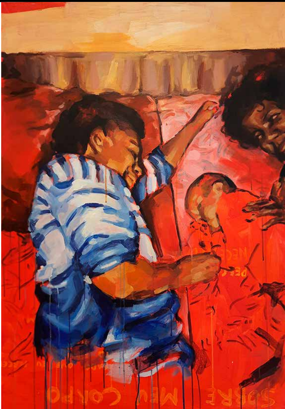
O porto, 2022. Acrílica sobre tela 116 x 81 cm.