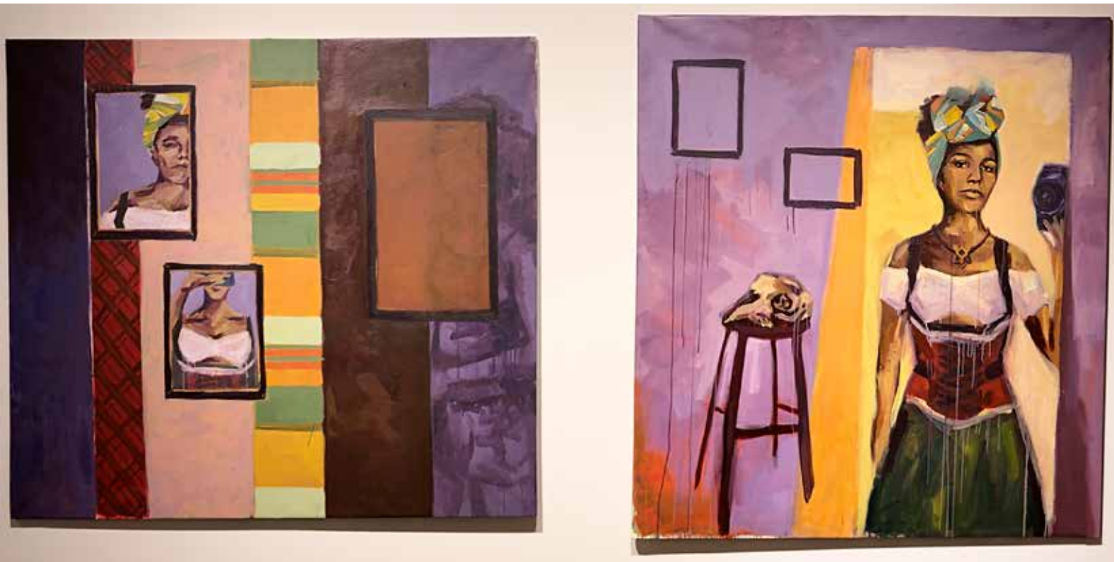
Encenação e Pertencimento (díptico), 2021. Acrílica sobre tela 150 x 170 cm / 170 x 150 cm. Fotografia: Filipe Conde.