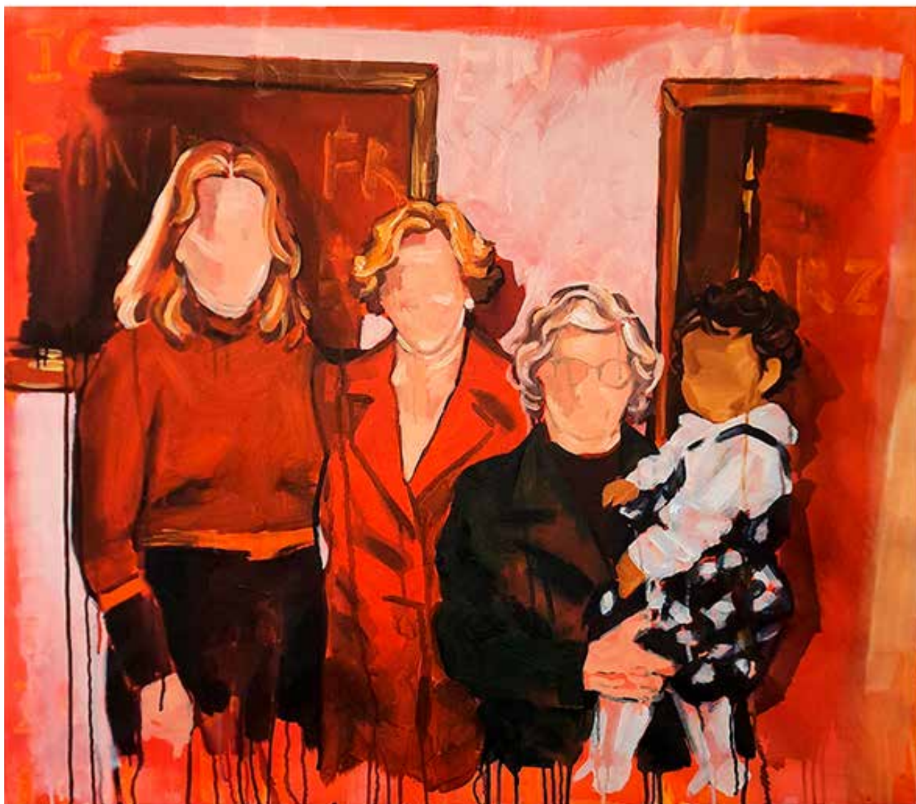
Vó Helga e bisá Herta, 2022. Acrílica sobre tela 88 x 100 cm.