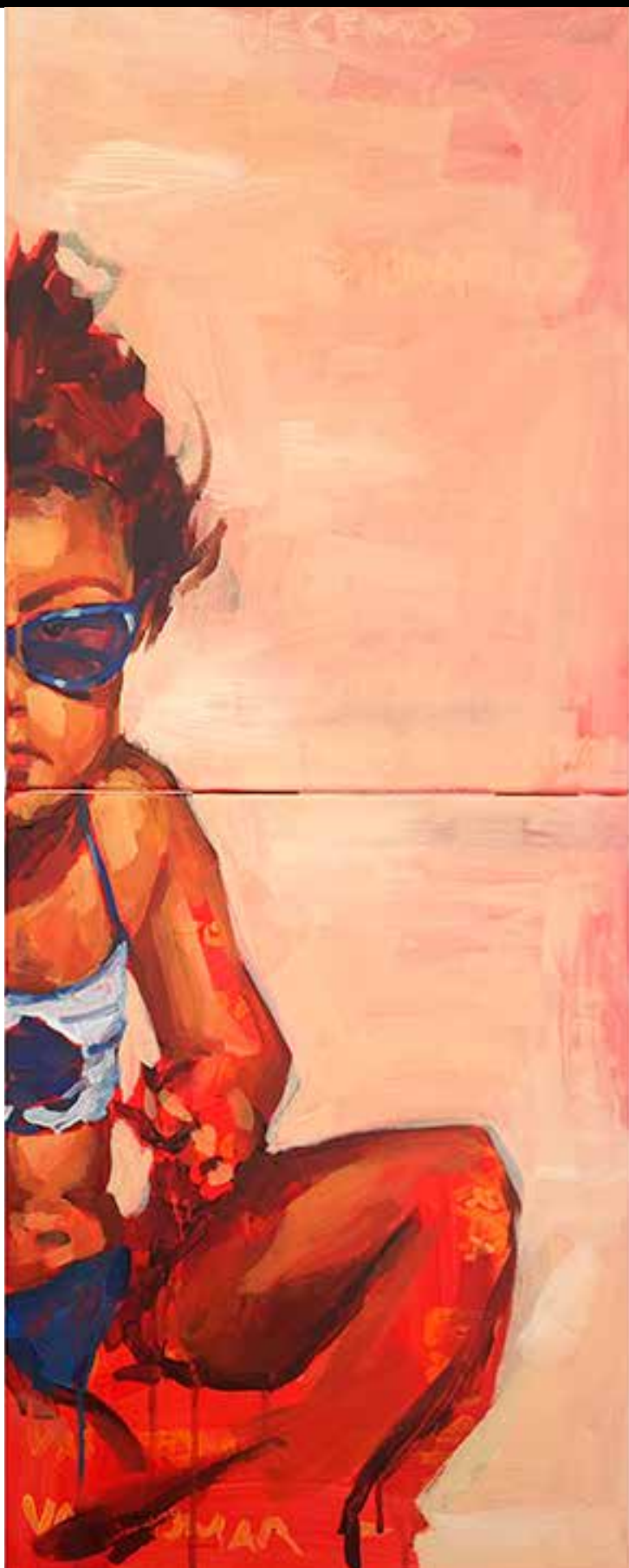
Quebrei a criança, 2022. Acrílica sobre tela 82 x 33 cm.