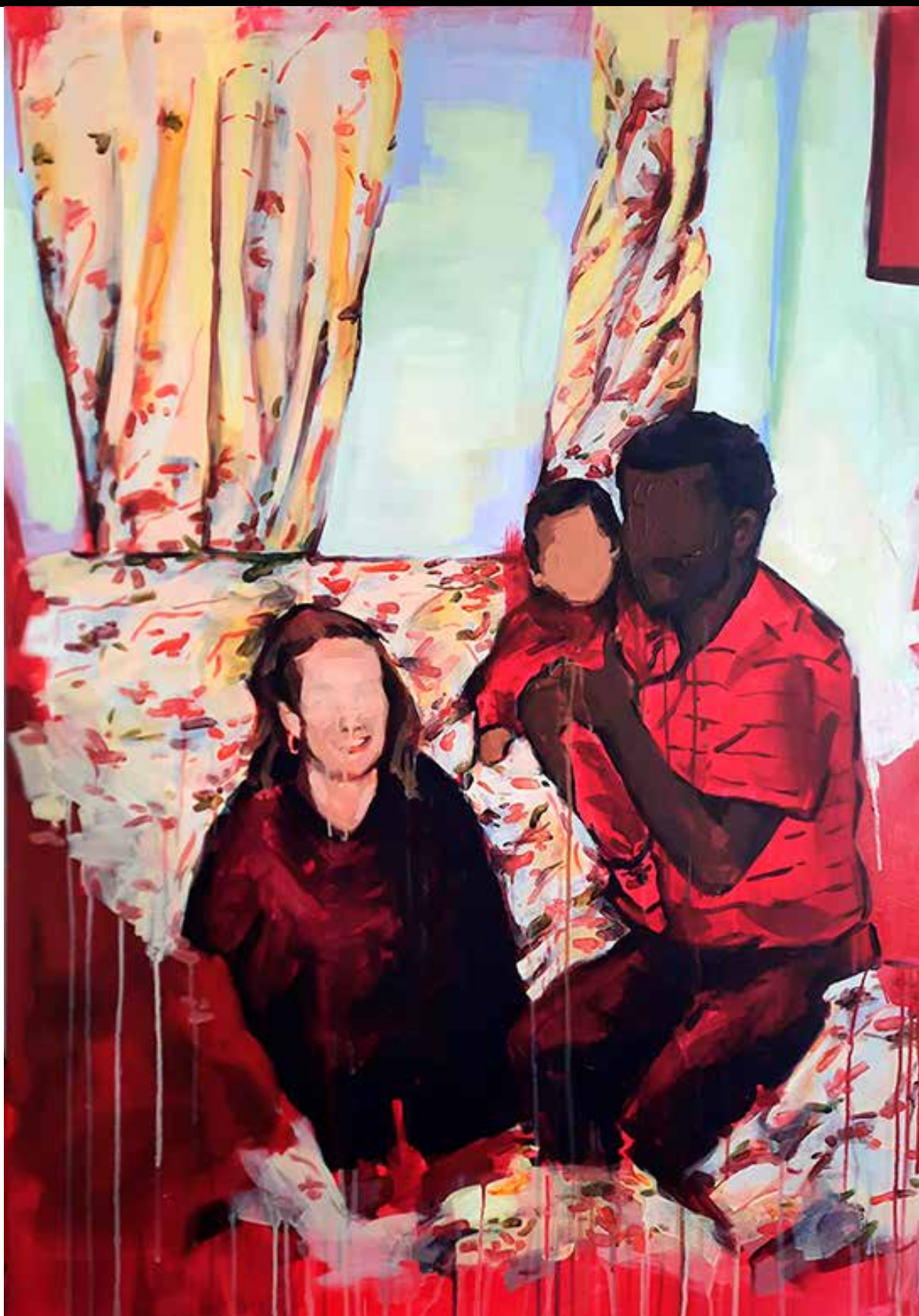
Papel de parede da memória, 2022. Acrílica sobre tela 116 x 81 cm.