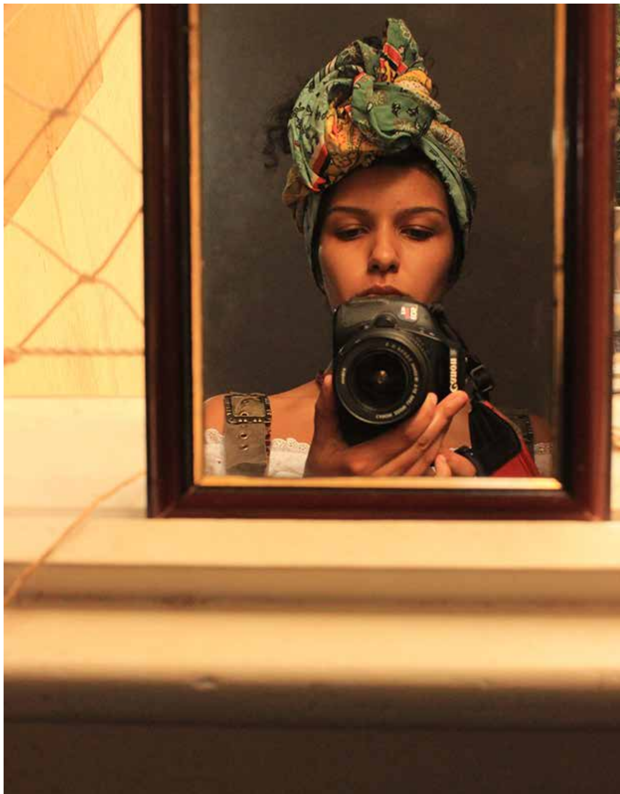
Documento de trabalho, 2020.