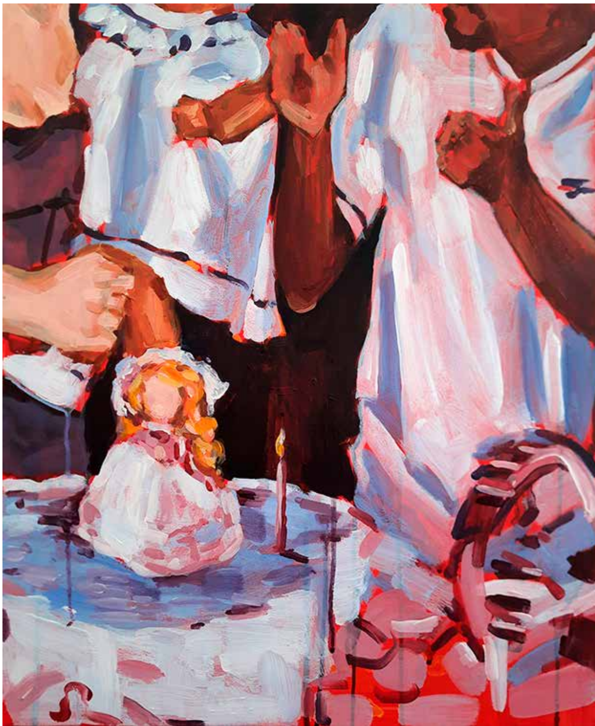
O problema do mestiço, 2022. Acrílico sobre tela 65 x 54 cm.