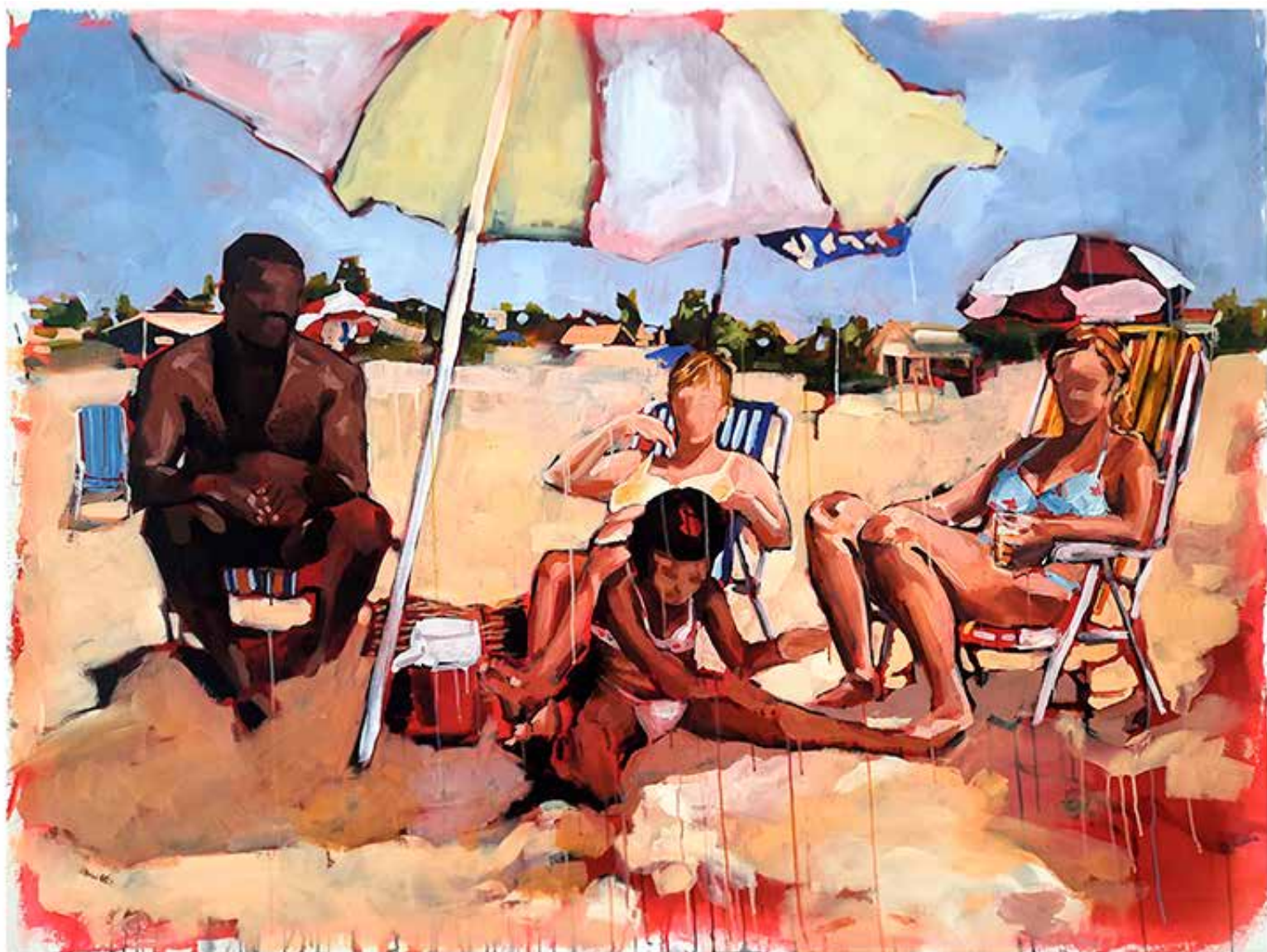
Corpos de praia, 2022. Acrílica sobre tela 130 x 170 cm.