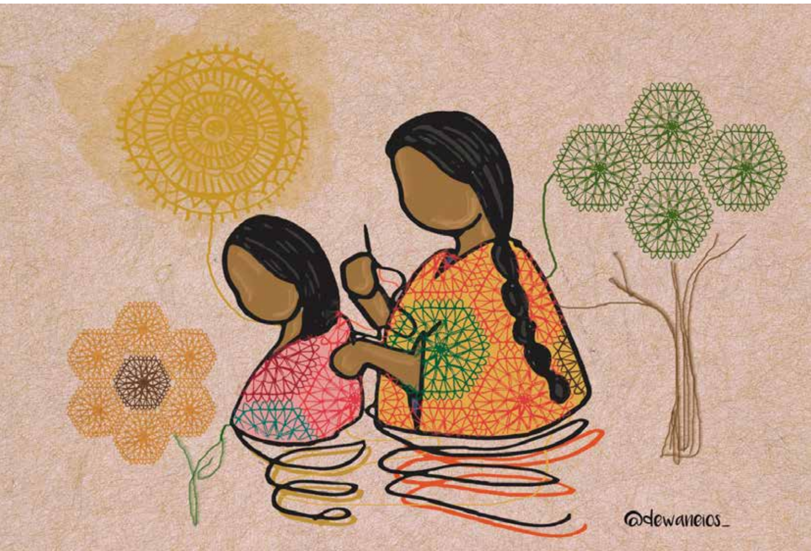
Tecendo afetos, 2023. Wanessa Ribeiro Ferreira