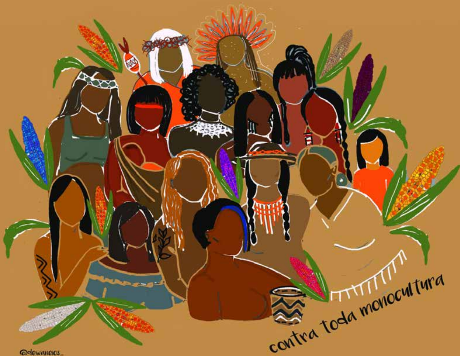
Contra toda monocultura, 2023. Wanessa Ribeiro Ferreira