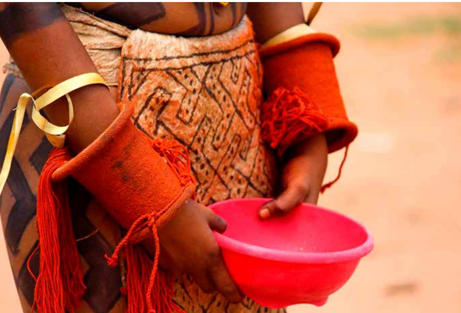
Fotografia na Aldeia Fontoura/TO. Hawalari Sandoval Coxini e Rafaella Sandoval Coxini Karajá, 2019