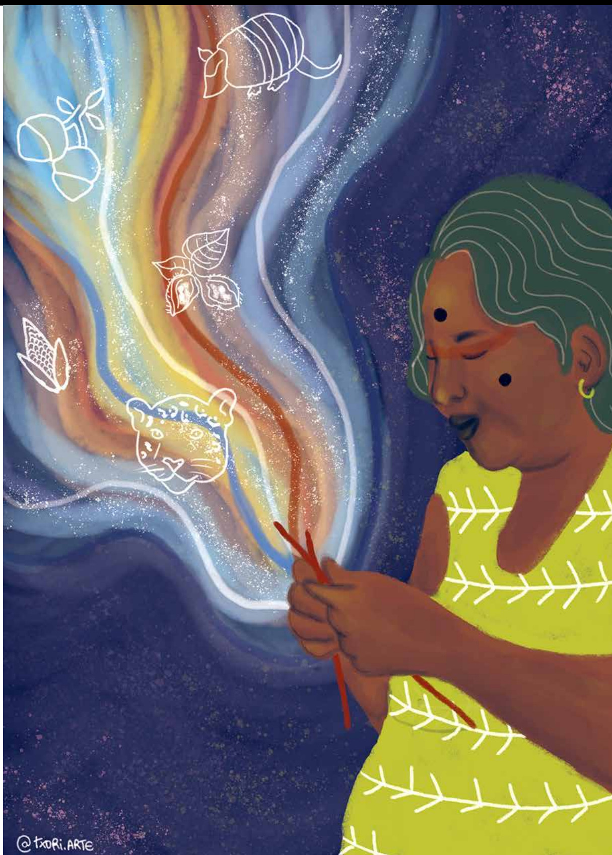
Bordado Ancestral, 2023, Ilustração digital tamanho A4. Kathellen