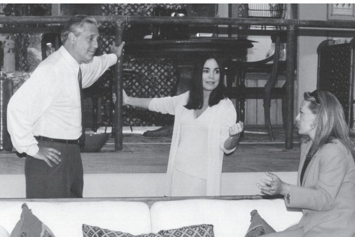
Por Amor , 1997-1998

Nas novelas atuais/contemporâneas/urbanas, você cita que "a moda pode significar apenas uma mudança nos costumes, um mecanismo pelo qual um grupo alimenta a sua identidade. Ou se torna, em outro extremo, em um mercado opressivo que atormenta o indivíduo, tira dele exatamente suas escolhas pessoais". Como é criar com esse cuidado? E quando você percebe que é melhor ter a assessoria de uma consultora de moda?